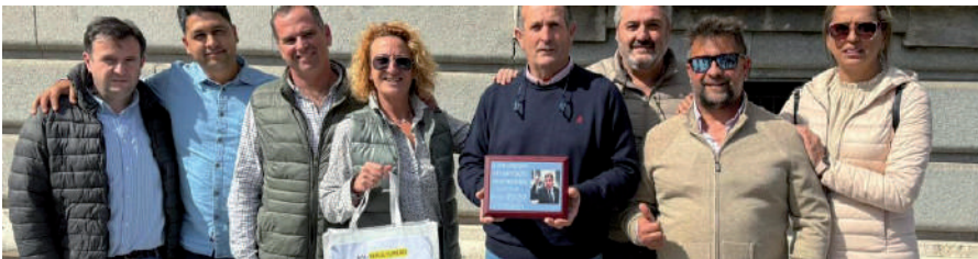
Representantes de Apag Extremadura Asaja y Comunidad de Labradores con la placa

Apag Extremadura Asaja hace llegar al Ministro de Agricultura una placa con esa declaración para nuestra región